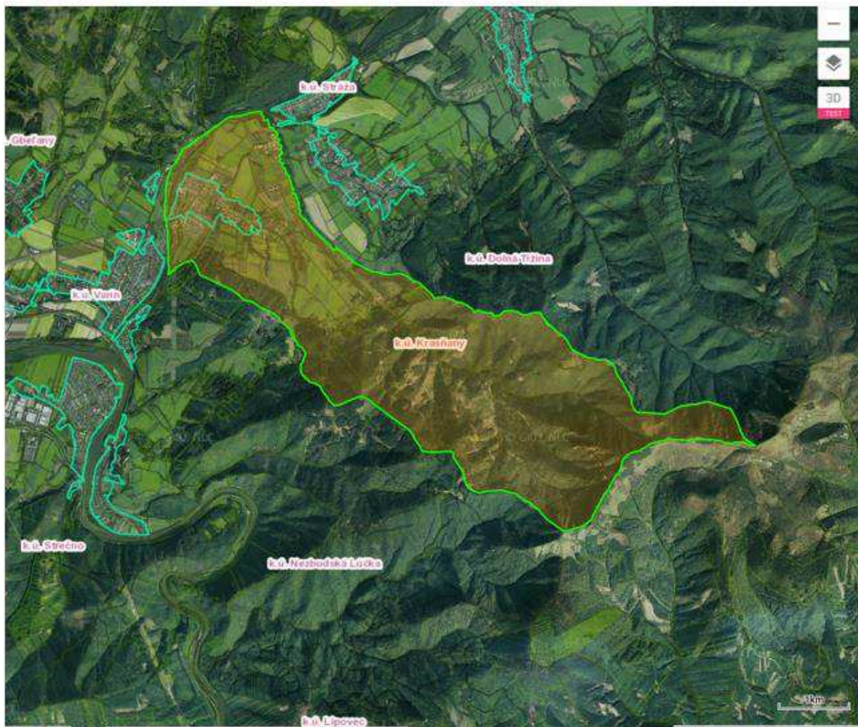
k. ú. Krasňany